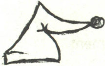
bonnet de nuit