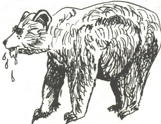
(Grossus balounæ Færocius)

Nous en sommes maintenant rendus à la partie zoologique de cette chronique qui fait les délices des étudiants d'IRO et d'aujourd'hui-O. Comme nous l'avons mentionné plus haut, l'animal de la rentrée est l'ours grizzly.