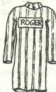
(PYJAMA) vue de dos